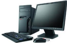
คอมพิวเตอร์ PC